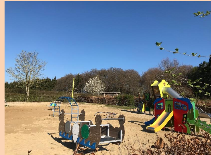
eis baussen Spillplaz op Mieressand