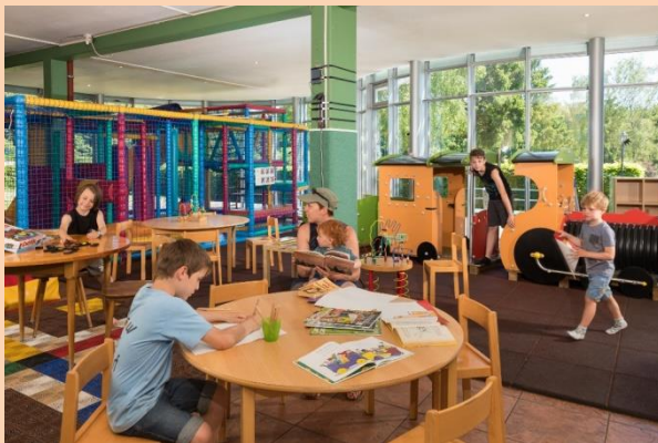
eis indoor Spillplaz